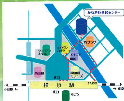
「横浜駅」西口・きた西口を出て徒歩 およそ5分